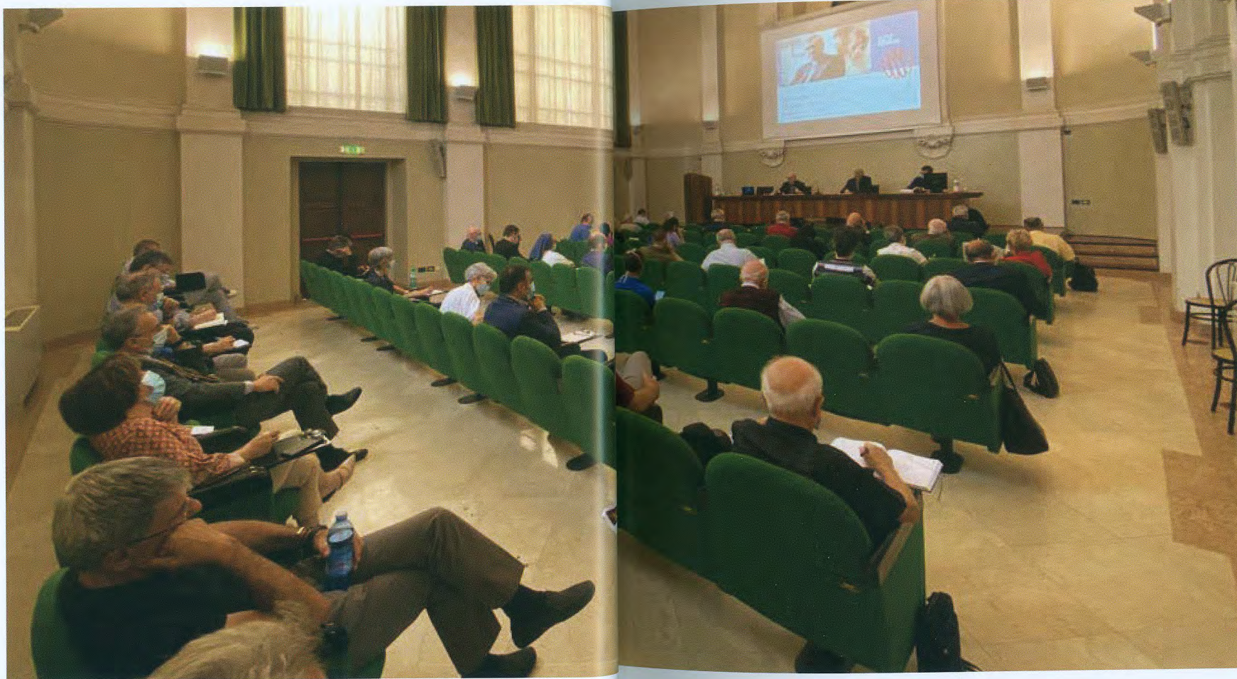
Brescia, Centro Pastorale Paolo VI, 27 giugno 2020, Consiglio Pastorale diocesano