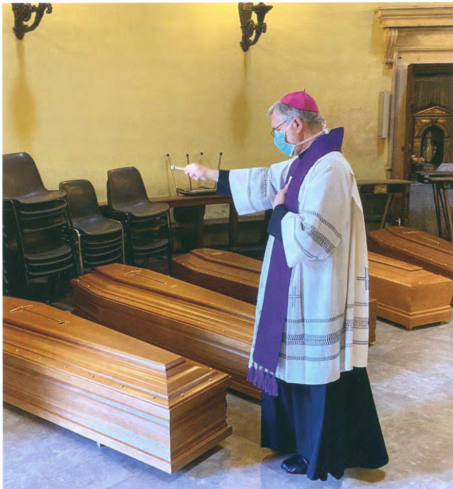
Brescia, Cimitero Vantiniano, 21 marzo 2020, benedizione dei defunti

gomento affrontato nel capitolo ottavo di Amoris Laetitia , cioè le esperienze matrimoniali ferite, e riprendere le linee di pastorale giovanile vocazionale che sono state recentemente pubblicate. Ricordo, infine, che nel corso del prossimo anno pastorale si procederà al rinnovo degli organismi di sinodalità dell'intera diocesi, in particolare dei Consigli Pastorali Parrocchiali e di Zona, del Consiglio Presbiterale e del Consiglio Pastorale Diocesano. Sono eventi importanti, che non potranno essere separati dalla rilettura spirituale che insieme intendiamo compiere.