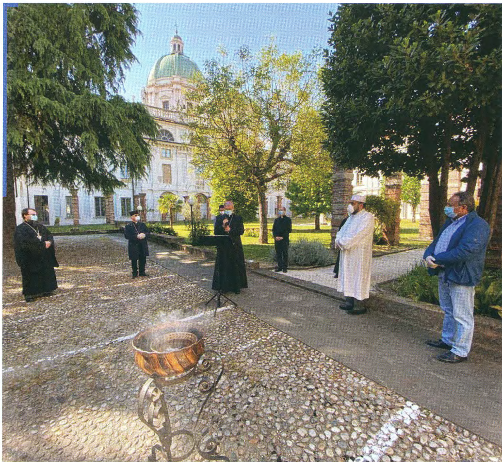
Giardino dell'episcopio, 22 aprile 2020, preghiera interreligiosa