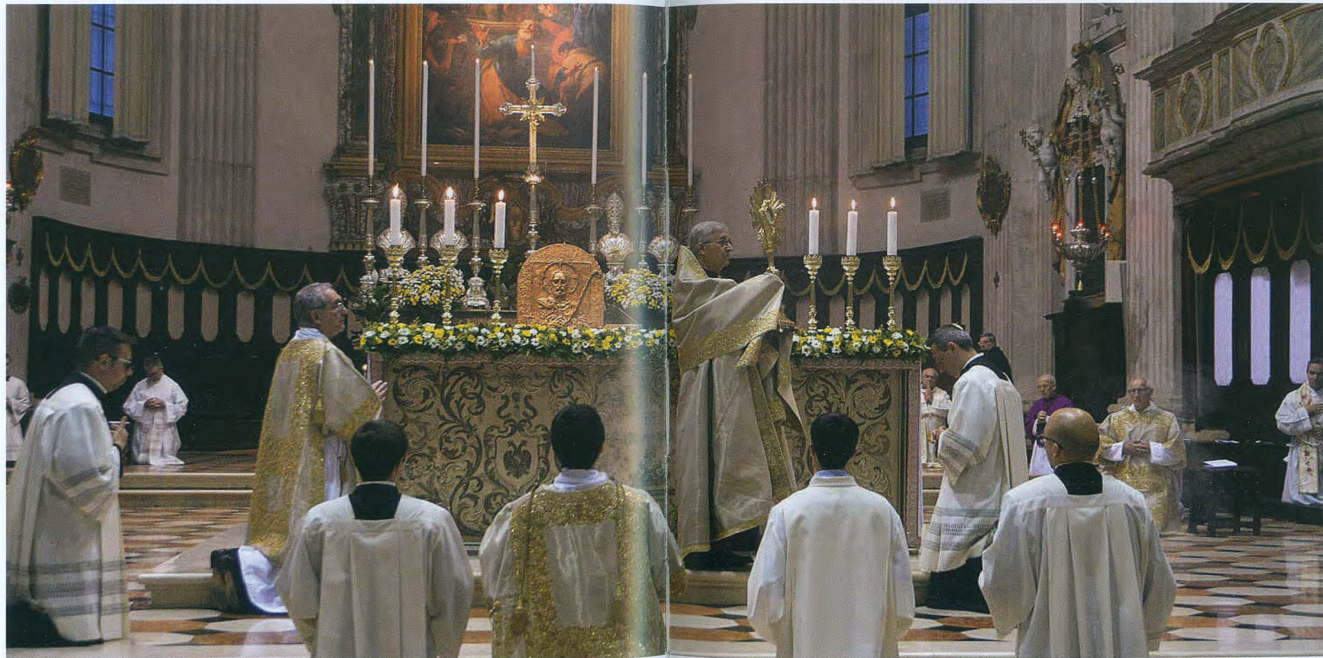
Brescia, Chiesa Cattedrale, 11 giugno 2020, Corpus Domini