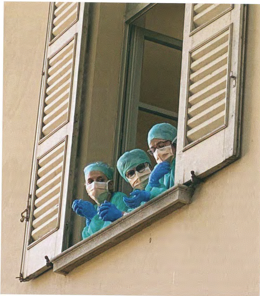
Centro Pastorale Paolo VI, 28 marzo 2020. Infermiere volontarie della Croce Rossa partecipano alla visita del Vescovo

la sul destino umano non è della morte ma di Dio. Nella luce della resurrezione di Cristo, la morte ha assunto una veste totalmente nuova: non quella della sovrana crudele ma – direbbe san Francesco – della tenera sorella, che ci accompagna all’incontro definitivo con il Padre celeste. Nella prospettiva cristiana morire è addormentarsi in Dio, consegnandosi con fiducia all’esito ultimo del nostro esistere, cioè all’eterna comunione dei santi.