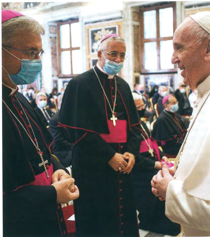
Città del Vaticano, 20 giugno 2020, udienza di Papa Francesco ai Vescovi e alle Istituzioni della Lombardia

convivenza civile abbia sempre più la forma della comunità e dove la politica si ponga umilmente a servizio di questo nobile progetto.